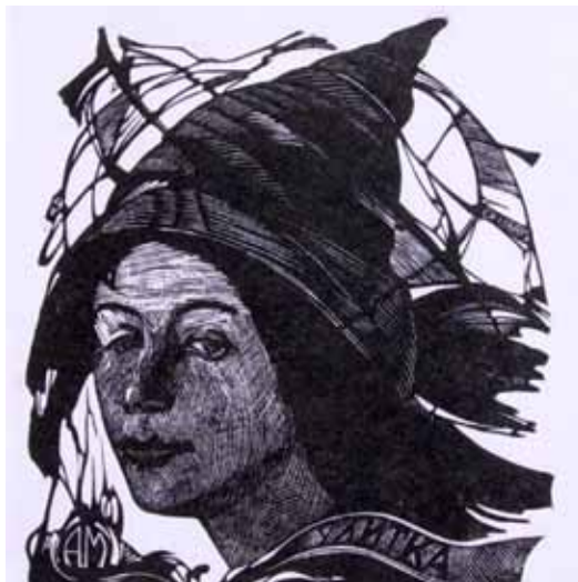
D. Krel - „Ślimak,, ekslibris

a następnie studiował na Wydziale Malarsko - Graficznym w Instytucie Pedagogicznym w Niżnym Tagile. prezentując na nich zarówno swoje prace malarskie, jak i graficzne. Na wystawie w Sławnie (jest to pierwsza wystawa jego prac w Polsce) obejrzeć można miniatury graficzne, w tym także ekslibrisy. Zwraca uwagę okazała ilość ekslibrisów dla dzieci, bądź poświęconych dzieciom. Wszystkie te niewielkich rozmiarów grafiki wykonane zostały w technice linorytu, i wszystkie zachwycają precyzją wykonania. W swoich pracach graficznych Dmitrij Krel w dość zaskakujący sposób łączy fotograficzny realizm z abstrakcją. Robi to tak umiejętnie, że to dziwne połączenie przeciwstawnych sobie sposobów obrazowania jest najczęściej przez odbiorcę przyjmowane jako coś najzupełniej naturalnego.(kb)